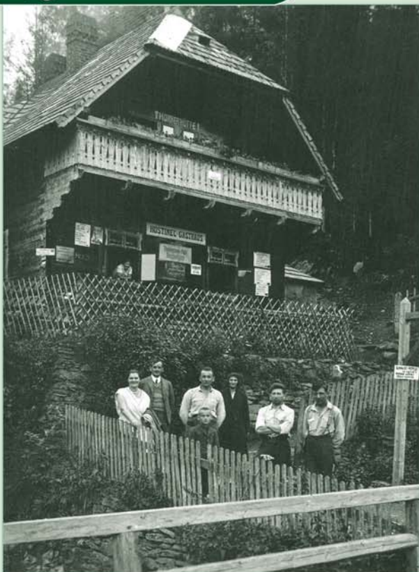
Na této pohlednici objevil J. Zelinger reklamní ceduli limonády Kalábria