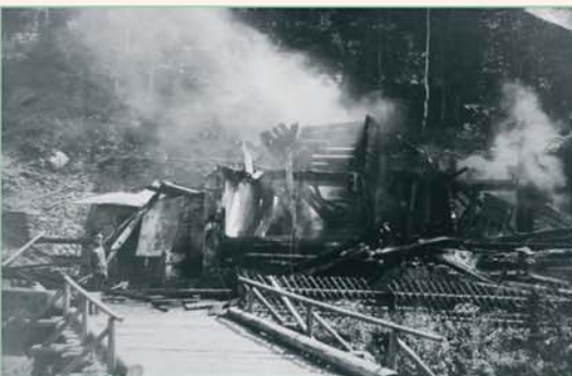
V roce 1932 chata kompletně vyhořela